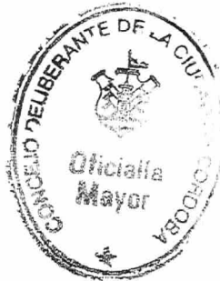
MARIA LUCRECIA BUSTOS ALDONZA OFICIAL MAYOR Concejo Deliberante de la Ciudad de Córdoba